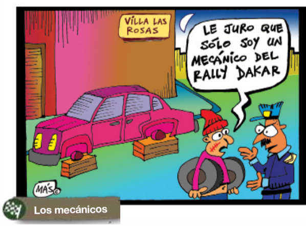
Chistes por Angonoa y Más